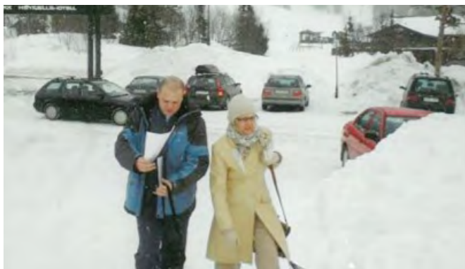
Kooliarendusprojekti raames Itaalias ja Norras.