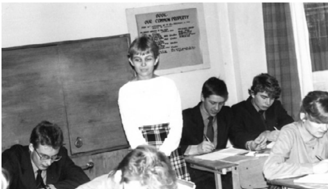
Esimesed sammud õpetajakarjääris.

Järgmiseks, kuuendaks mõjutajaks oli Eve sõnul tema esimene töökoht Fr. R. Kreutzwaldi nimelises Võru I Keskkoolis, kus ta asus tööle võõrkeelte eriklassi ühe inglise keele õpetajana. Ta mainib ka, et neid, TRÜ kasvandikke, ei valmistatud koolmeistriametiks ette sellises mahus nagu Tallinna Pedagoogilise Instituudi üliõpilasi, seepärast oli tal tundideks väga palju ettevalmistavat tööd, mis lükkus vahel ka öötundidesse. Lisaks sellele oli ta juba ka kahe lapse ema.