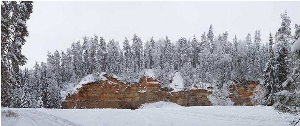
Joonis 1. Suur Taevaskoda talvel (Otsar, 2010)

Diagrammid tehakse tasapinnalised. Diagrammidel olev tekst ja arvud vormindatakse Times New Roman kirjas suurusega 11 või 12 punkti, aga kõigil diagrammidel ühtemoodi. Diagrammi telgedele, millel on arvandmed, tuleb lisada telje nimed, välja arvatud juhul, kui teljel on kuupäevad või aastad ning sellest arusaamiseks vajalik info on joonise allkirjas. Diagrammile peakirja (tiitlit) ei lisata, diagrammi alla tehakse joonise allkiri. (vt Joonis 2)