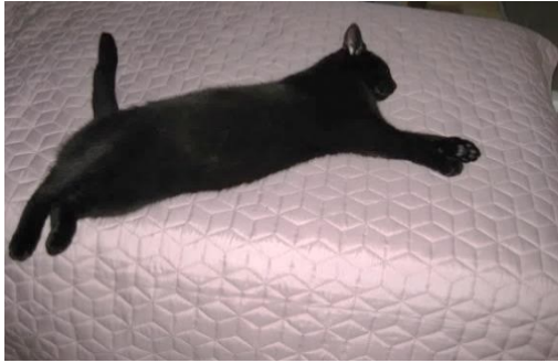
Joonis 4. Kass Lord lõunauinakut tegemas

Kui fotograaf pole teada, sisestatakse sulgudesse, et fotograaf teadmata, näiteks: (Fotograaf teadmata, 2020, Kaja Kengi perekonnaarhiiv).